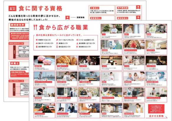
食から広がる職業シート

※サイト内の他のインタビュー内容もプロフェッションシートとして順次ダウンロードが可能になります。