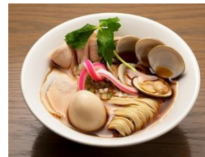
「むぎとオリーブ」店舗イメージと看板主力商品の『蛤 SOBA』